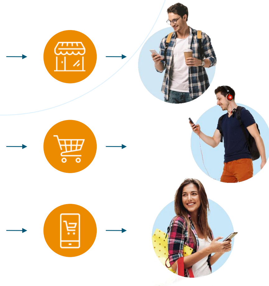
Single channel- betalinger