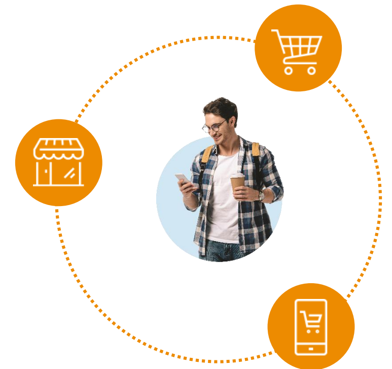
Betalinger som enabler af OmniChannel