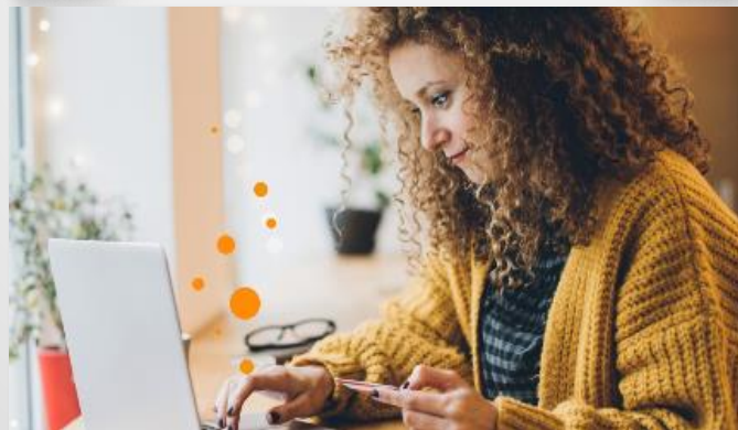
Betal via chat bots