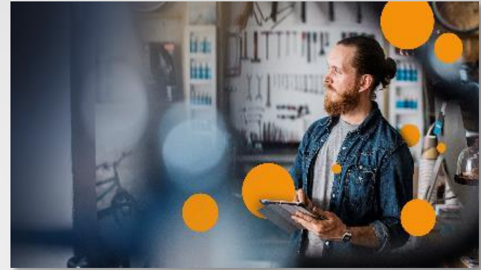
Betal via Blockchain