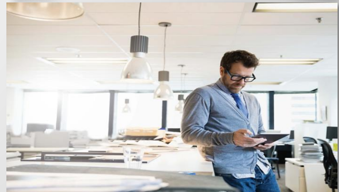
Fraud / dispute håndtering via AI