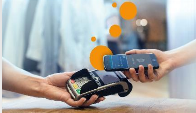
Betal med din smart phone