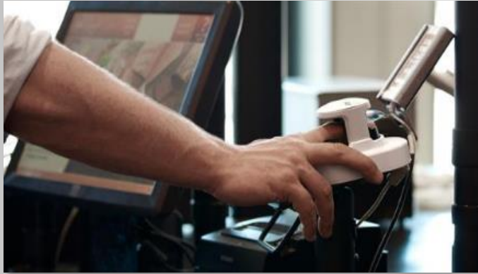
Betal med din finger